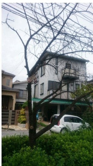
B118 緋寒桜 枯れ木の状態