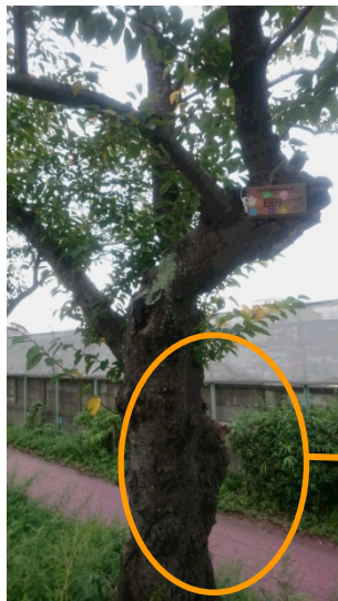
幹の根元の切り株跡が劣化