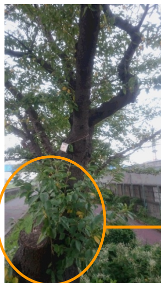
根元の切り株跡が劣化